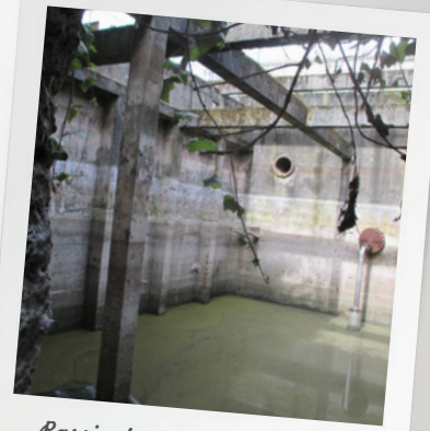
Bassin de stockage de 2 000 m 3 (récupération d'ouvrages existants)

Après traitement dans un décanteur/déshuileur, ces eaux sont ensuite stockées dans une tranchée drainante de 180 m 3 puis infiltrées dans le sol. L'excédent est rejeté, à débit maîtrisé, vers le réseau d'assainissement communautaire. Une étude de perméabilité a permis de confirmer la faisabilité du projet.