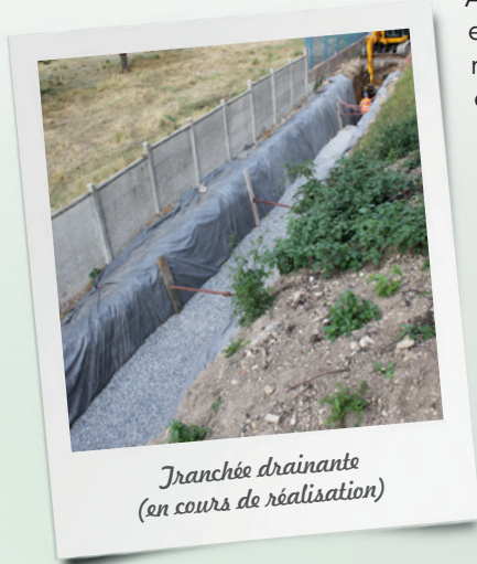
Tranchée drainante (en cours de réalisation)