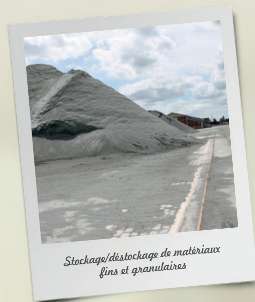
Stockage/déstockage de matériaux fins et granulaires