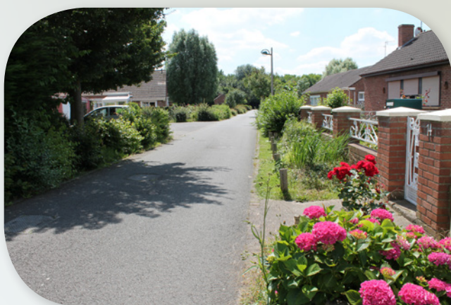
Les noues conjuguent espaces verts et fonction hydraulique (Cf. Fiche technique n°3).