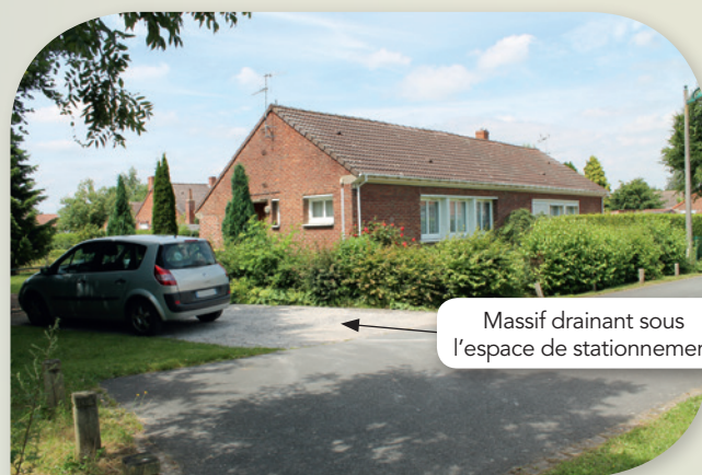
Les stationnements sur parcelles intègrent un massif drainant qui permet de gérer et d'infiltrer les eaux de toitures.