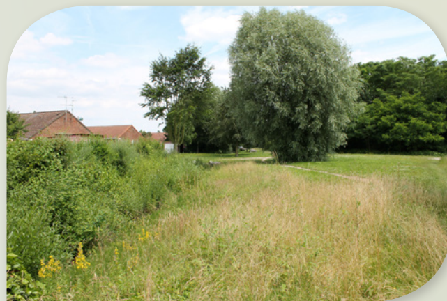
La liaison vers l'exutoire final s'effectue via une noue végétalisée avant rejet au milieu naturel.