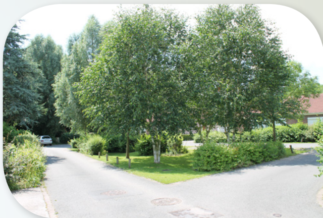
Les espaces verts participent au tamponnement des eaux pluviales et accueillent du stationnement relais.